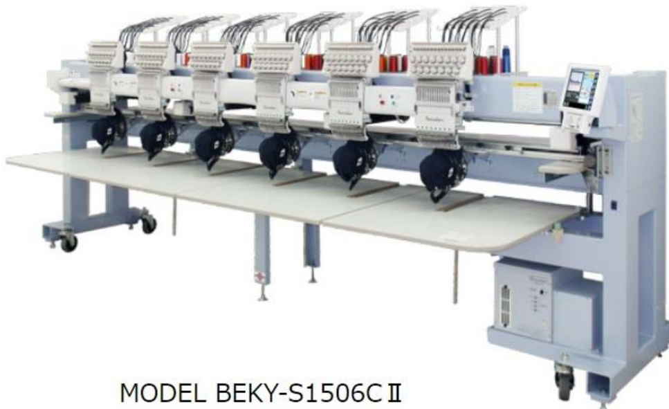
MODEL BEKY-S1506C II